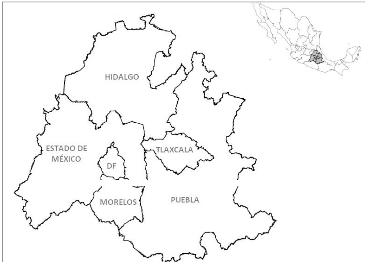
Mapa 1. Región Centro de México