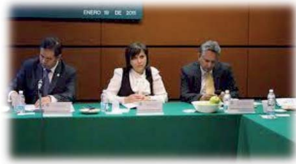
XII Reunión de Junta Directiva