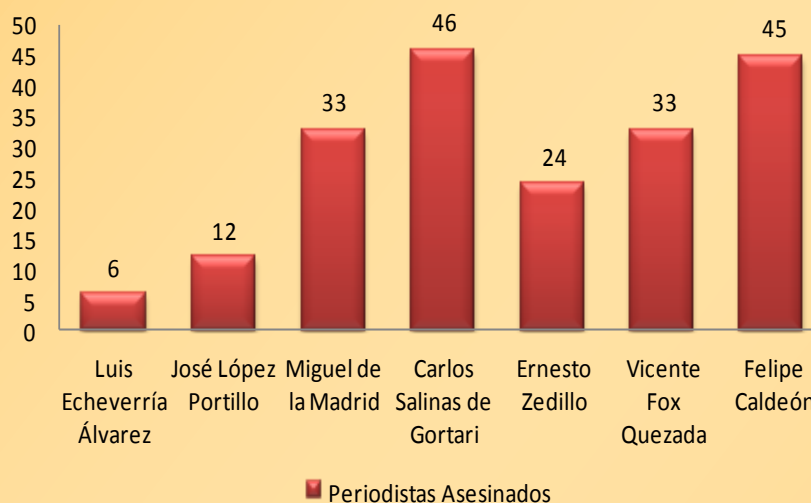
Gráfica 1 Periodistas asesinados, por sexenios (1970-2011).