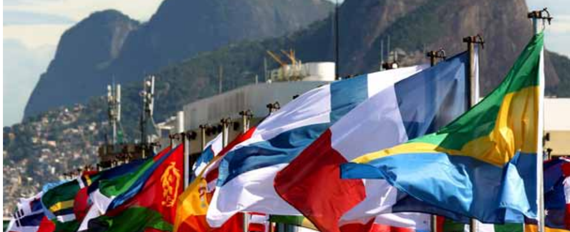
Río +20, Conferencia de las Naciones Unidas sobre el Desarrollo Sostenible

Nosotros, los Jefes de Estado y de Gobierno y los representantes de alto nivel, habiéndonos reunido en Río de Janeiro (Brasil) entre el 20 y el 22 de junio de 2012, con la plena participación de la sociedad civil, renovamos nuestro compromiso en pro del desarrollo sostenible y de la promoción de un futuro económico, social y ambientalmente sostenible para nuestro planeta y para las generaciones presentes y futuras.