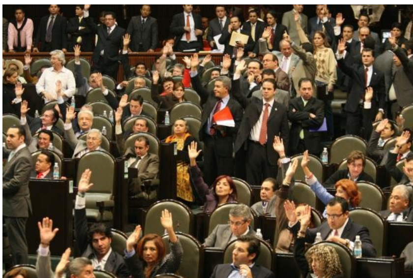
Diputados de la LXI Legislatura del Congreso de la Unión