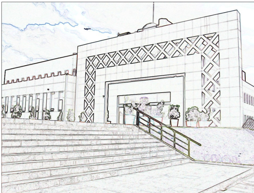
La transformación de la Cámara de Diputados Efrén Arellano Trejo