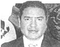
DIP. RICARDO ASTUDILLO SUÁREZ Sustituto GP-PVEM