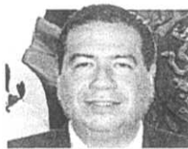
DIP. RICARDO MEJÍA BERDEJA Sustituto GP-MOVIMIENTO CIUDADANO [Signature]