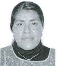
Dip. Eufrosina Cruz Mendoza