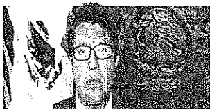
DIP. RICARDO MONREAL ÁVILA Titular GP-MC