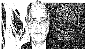
DIP. MANUEL AÑORVE BAÑOS Presidente GP-PRI