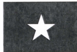
Dip. Lisandro Aristides Campos