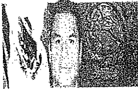
DIP. WILLIAMS OSWALDO OCHOA GALLEGOS Presidente GP-PRI