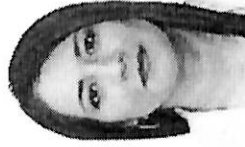
DIP. Claudia Reyes Montiel GP. PRD