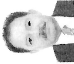
PRESIDENTE DIP. Moisés Ignacio Mier Velazco GP. MORENA